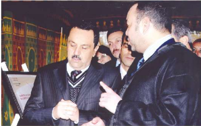
Présentation des réalisations sociales d'Universiapolis devant Sa Majesté le Roi Mohamed VI, Juin 2009