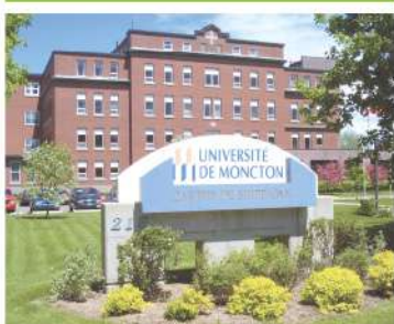
Université de Moncton-Canada