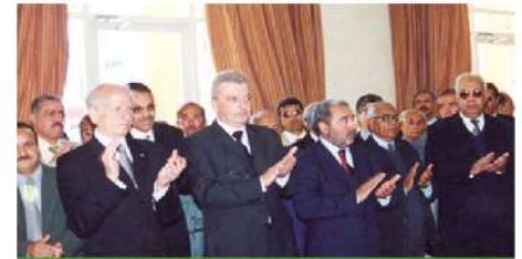
Convention de partenariat avec l'association Essaouira Mogador par le Conseiller de Sa Majesté, 2002