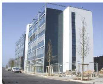
Centre Henri Tudor-Luxembourg