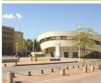
IAE de Metz-France