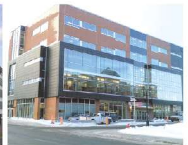
Université du Québec en Outaouais-Canada