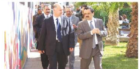
Visite du secrétaire d'Etat chargé de l'alphabétisation, 2006