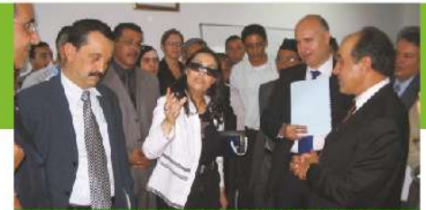
Lancement du Programme CAMA à Rabat par le Ministre de la Solidarité et le Ministre de l'Alphabétisation, 2005