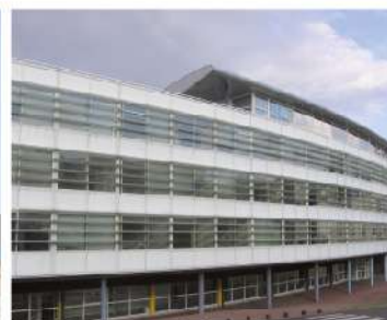
IAE de Nancy-France