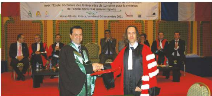
Signature de convention avec l'École doctorale de l'Université de Lorraine pour la création de l'École doctorale Universiapolis, 2011