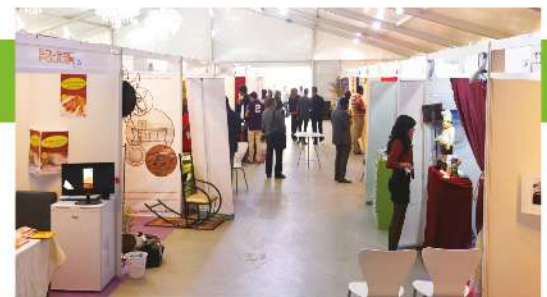
Salon Fiera 2014-2015 pour la création d'entreprise

Le service Stage et Insertion de l'ISIAM facilite l'accès aux stages et l'insertion des étudiants grâce aux différentes conventions signées avec les entreprises partenaires et grâce au suivi permanent des lauréats.