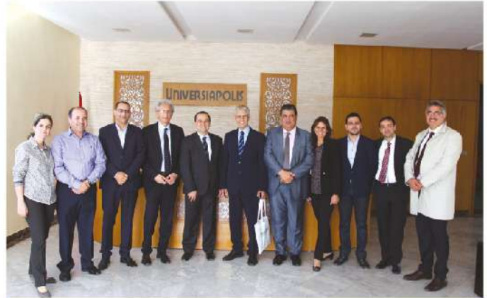
M. Daoudi, ministre de l'enseignement supérieur et de la recherche scientifique en visite au campus d'Universiapolis, 2014