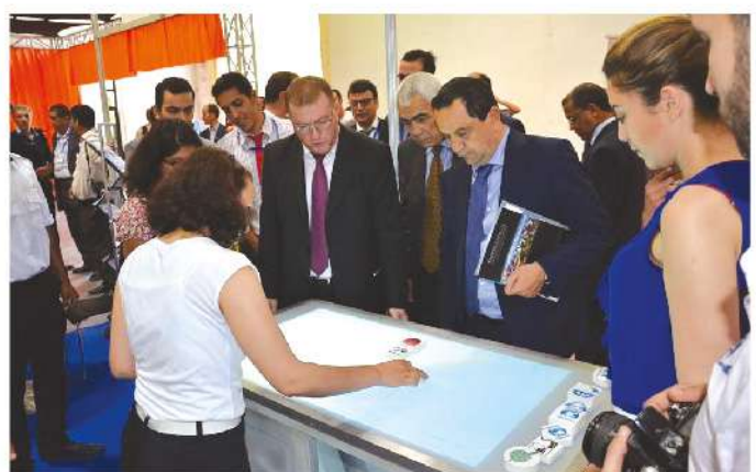
Le Ministre de la Logistique et du transport en compagnie du Président d'Universiapolis au Salon de la logistique, 2015