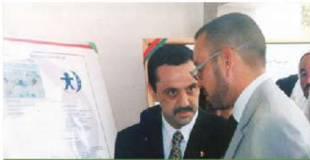
Sa Majesté le Roi Mohammed VI, prenant connaissance des réalisations du CNDA, 2000

ISIAM-Agadir a créé en 1998, le CNDA (Centre National d'Alphabétisation et de Développement) une association à but non lucratif ayant pour but d'alphabétiser la femme et la fille en milieu rural et de promouvoir des activités féminines génératrices de revenus.