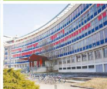
Université de Strasbourg