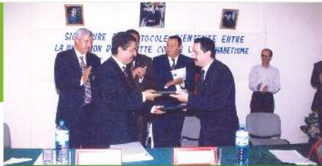
Signature de convention de partenariat avec la Direction d'Alphabétisation 1999