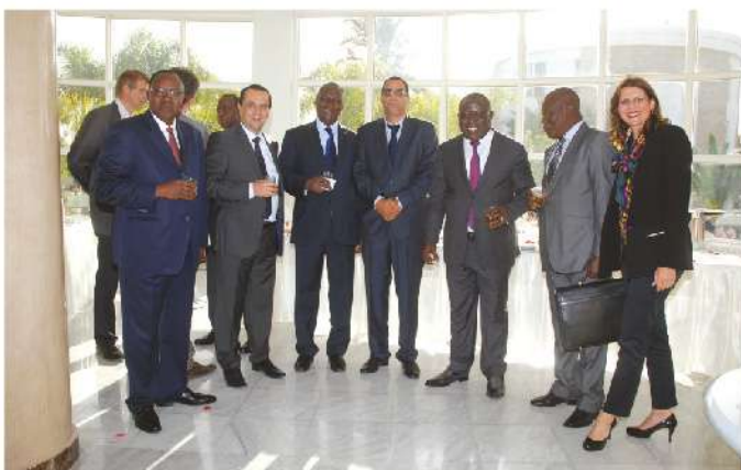
Délégation ministérielle de la cote d'Ivoire composée du Ministre des affaires présidentielles, Ministre de l'enseignement supérieur et le Ministre des Ivoiriens à l'Étranger, 2013