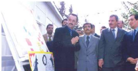
Visite du Ministre de l'Enseignement Supérieur, 1998

Le CNDA a pu réaliser depuis 1998 à nos jours :