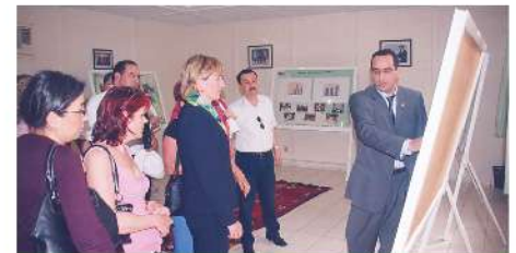
Visite de Mme l'Ambassadrice du Canada au Maroc, 2005