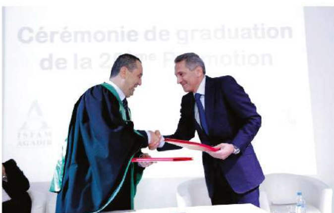
Cérémonie de graduation de la 2 ème Promotion