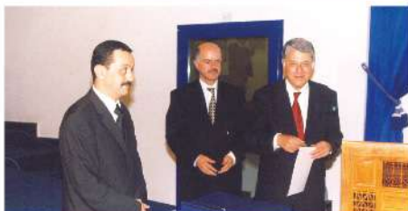
Lancement de la Campagne d'alphabétisation par le Ministre de l'Emploi 2001