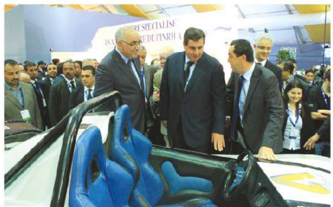
Le Ministre de l'économie et des finances, le Ministre de l'Agriculture et le Ministre délégué à l'intérieur en compagnie du Président d'Universiapolis au salon Halieutis, 2013