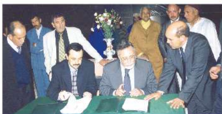
Signature de convention de partenariat avec le Ministre de l'Agriculture 2001