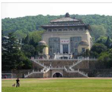
Université de Wuhan-Chine