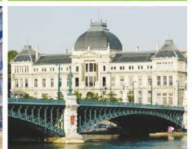
Université de Lyon3-France