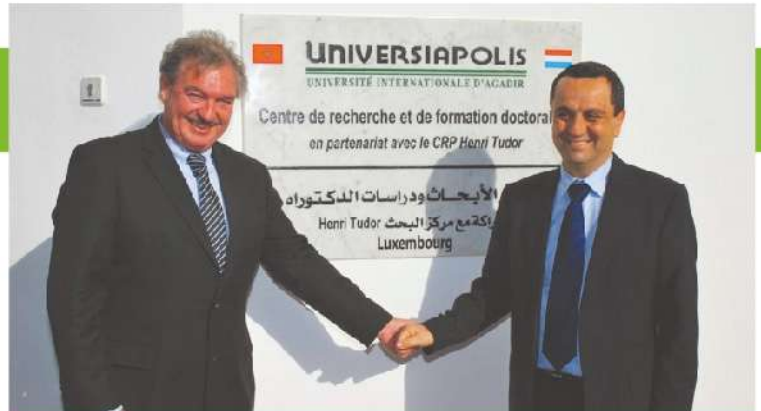
Visite Monsieur Jean ASSELBORN Vice Premier Ministre et Ministre des Affaires étrangères de Luxembourg à l'état doctorale Universiapolis créée en partenariat avec C.R.P. Henri Tudor - Luxembourg, 2008

Dès sa création, l'ISIAM a opté pour l'ouverture sur l'international. Cette volonté s'est concrétisée par les conventions de coopération et d'échange avec diverses universités canadiennes, françaises et chinoises. Divers partenariats ont été établis avec l'objectif de concevoir des formations communes en co-diplômation et d'établir des programmes d'échange d'étudiants et de professeurs.